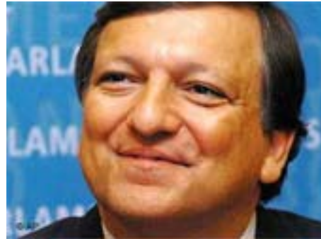
Il presidente della Commissione europea José Manuel Barroso

Dalle 15.30 alle 17.00 cerimonia ufficiale con la presenza dei ministri degli esteri di Italia e Slovenia ed una ristretta cerchia di autorità presenti. Inutile, nel caso che qualcuno lo desiderasse, cercare