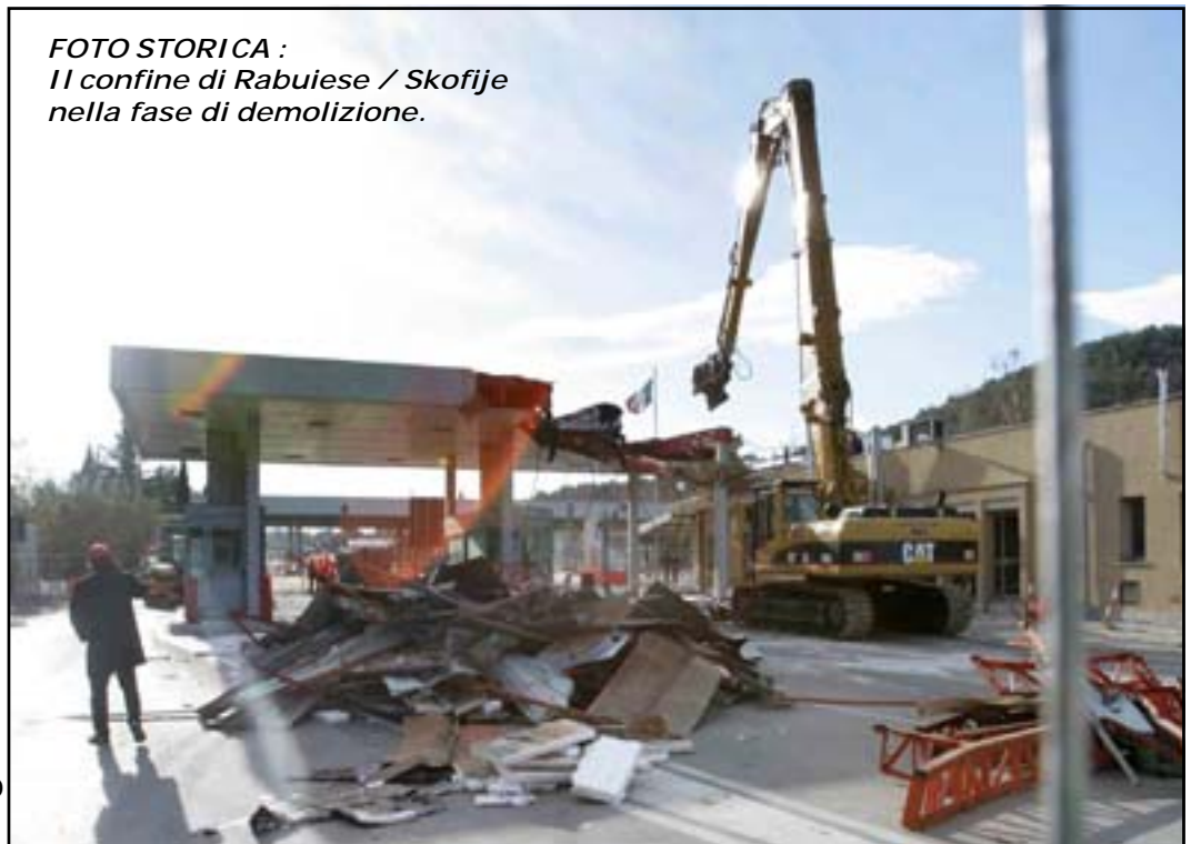
FOTO STORICA : Il confine di Rabuiese / Skofije nella fase di demolizione.